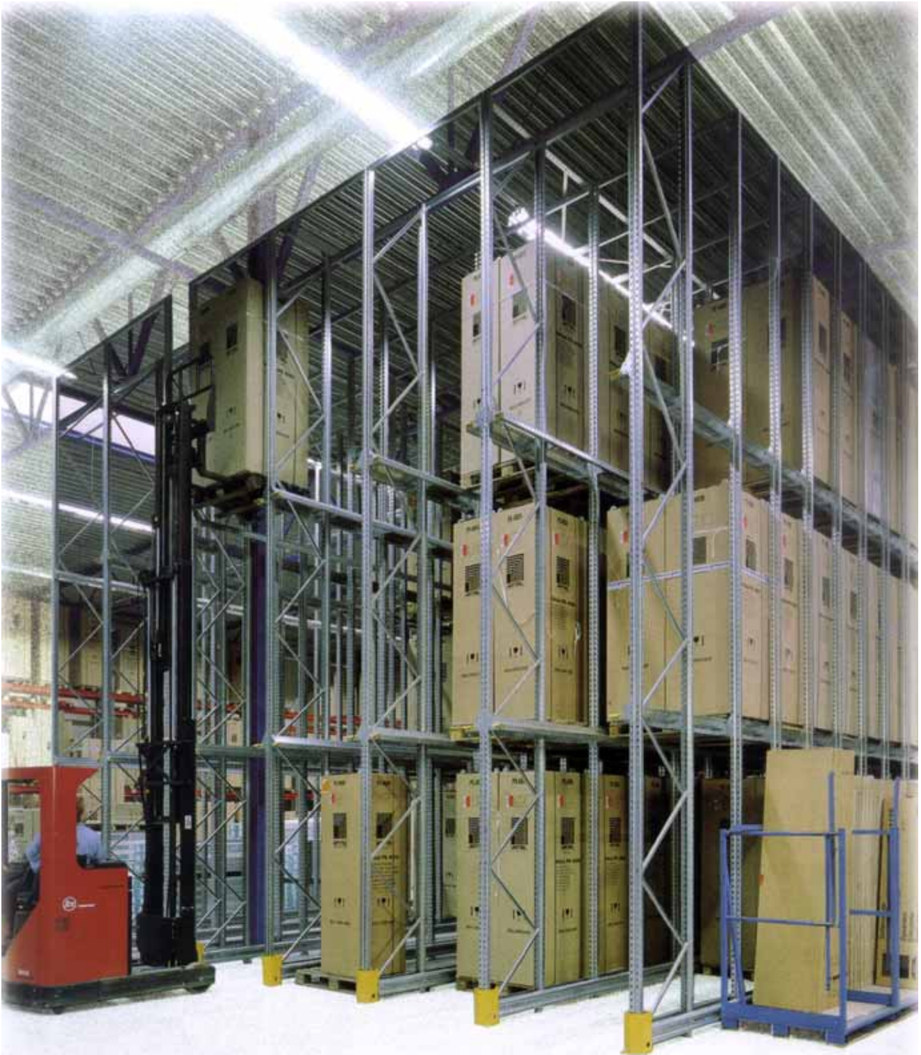
DEEPSTOR P90 - Kompaktes Lagern in P90 Einfahrregalen. Deepstor P90 steigert die Lagerkapazität nach dem LIFO (Last In First Out) Prinzip.